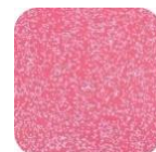
Glitter Pink G390