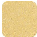
Glitter Gold GM410