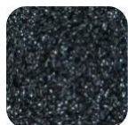
Glitter Black G199