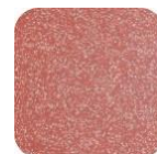
Glitter Red G350