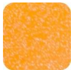
Glitter Orange Fluo GF370