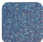
Glitter Blue G230