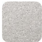
Glitter Silver GM150