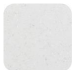
Glitter White G100