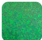
Paillettes Green P540