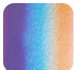
Paillettes Multicolor P-Multi