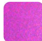
Paillettes Fucsia P2329