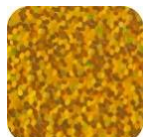
Paillettes Gold P410