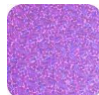
Paillettes Violet P2685